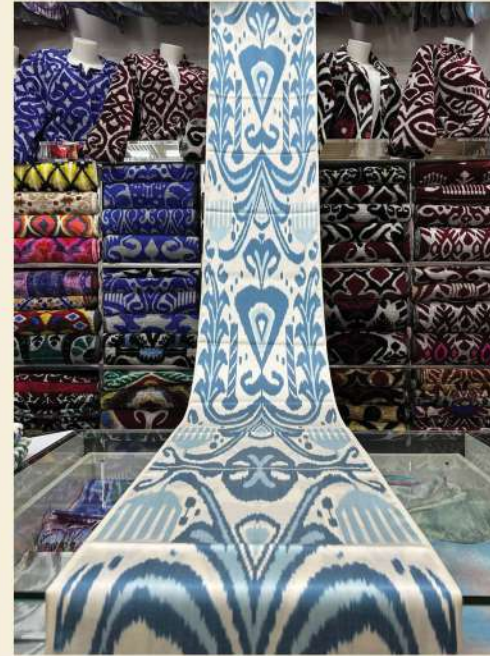
IKAT BAUMWOLLE & SEIDE