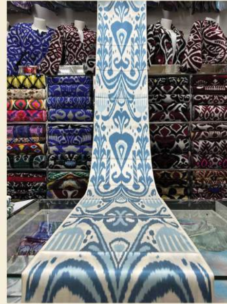
IKAT BAUMWOLLE & SEIDE